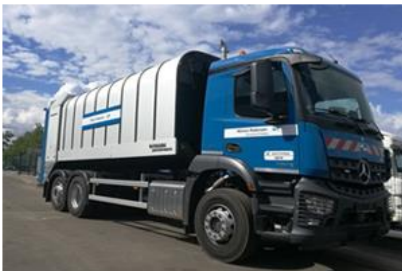
ROTOPRESS- bubnový lis.

Auta jsou schopná lisovat všechny druhy odpadu. To znamená, pokud auto veze ráno směsný odpad, tak odpoledne může odvážet plast. Do takového auta se vejde většinou (u větších aut) od 6 tun odpadu po 10 - 12 tun odpadu najednou. Většina svozových firem má VARIOPRESS.